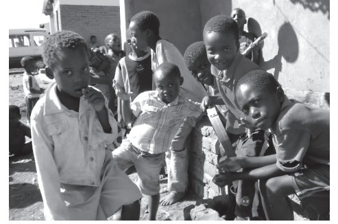
Met mijn vrienden speel ik het liefst buiten.

Verplaats je in Razul en denk na over de volgende vragen: