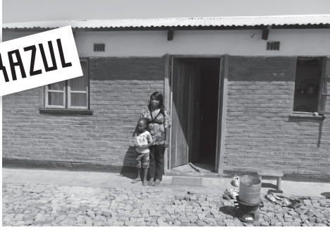
Mijn moeder kookt het eten en ik lees een boekje.