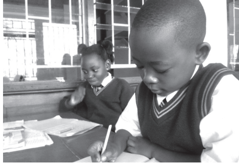
Rekenen is mijn lievelingsvak op school.